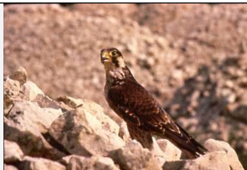
Faucon pèlerin