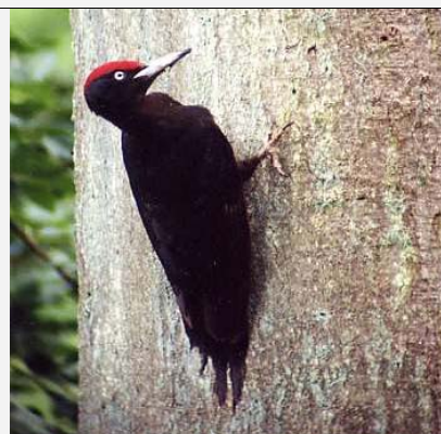
Pic noir