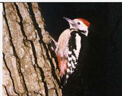
Pic mar