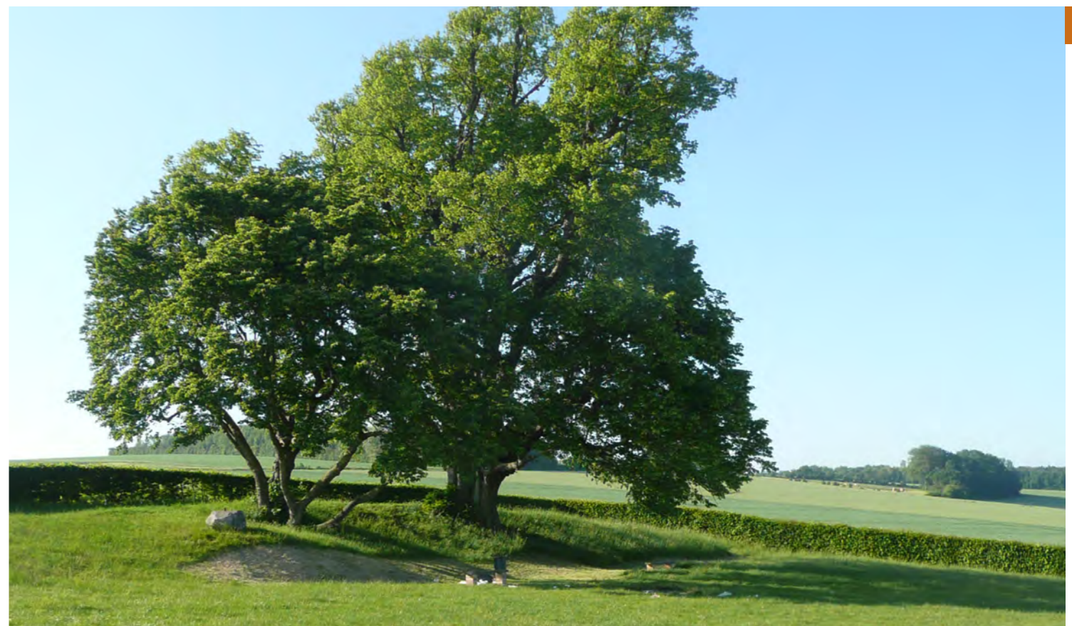
En haut à droite : le vieux tilleul en venant de Saint-Léger-les-Domart - En bas, à droite : les tilleuls sur le relief du rideau