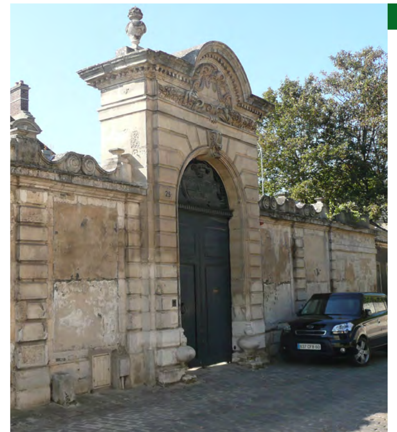
En haut à droite : la rue de Beauvais - En bas, à gauche : L'église Saint-Aignan, à droite : le portail de l'Hôtel de la Londe, 25 rue de Beauvais