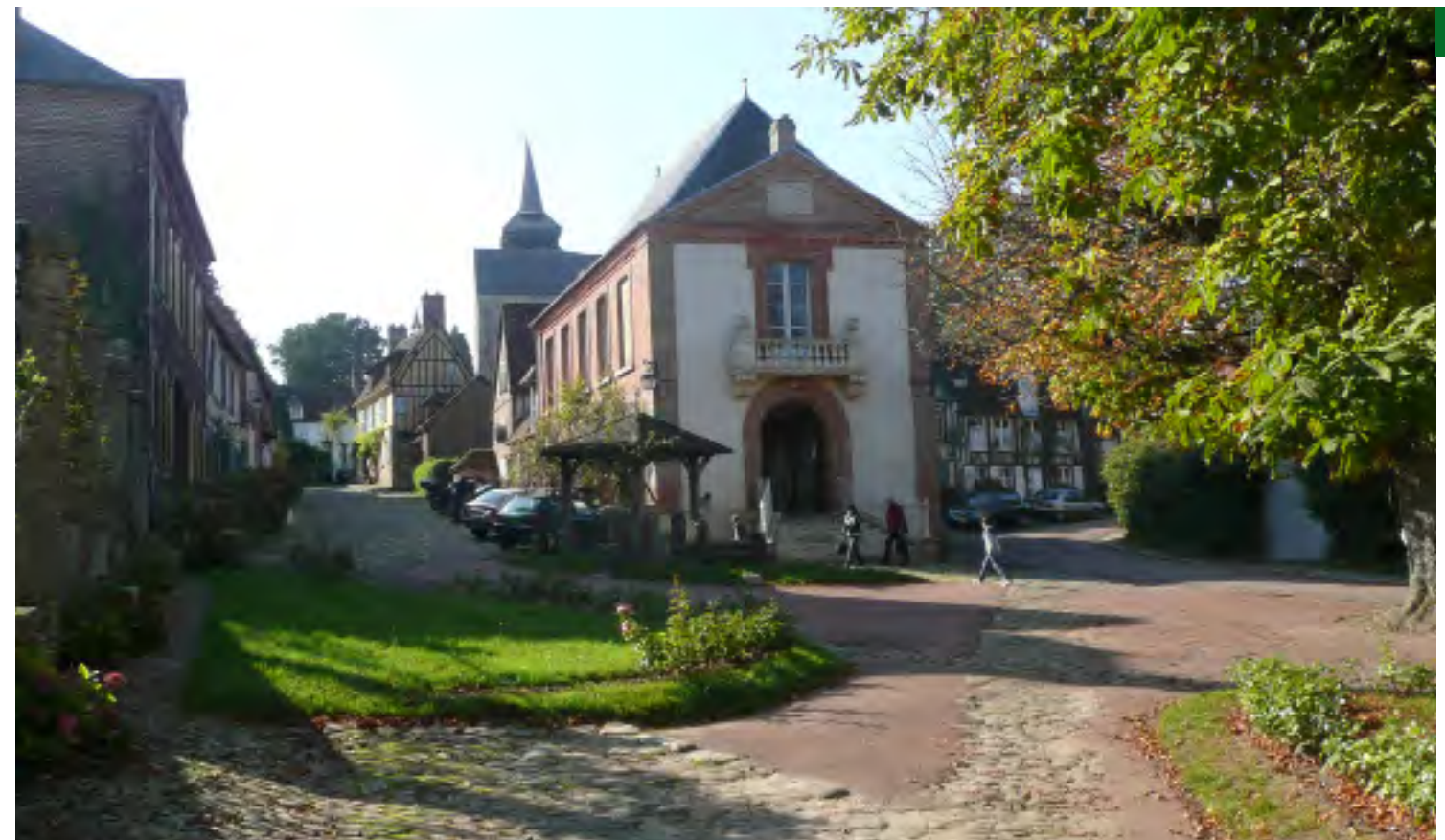
En haut à gauche : Gerberoy vu de la route de Buicourt, En bas à droite : la place de la mairie