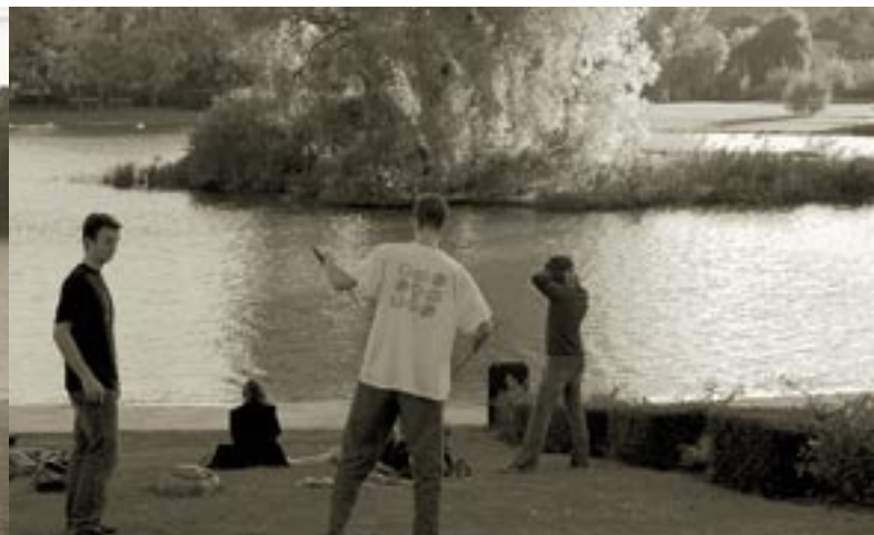
... pour la contemplation et l'intimité for contemplation and privacy.