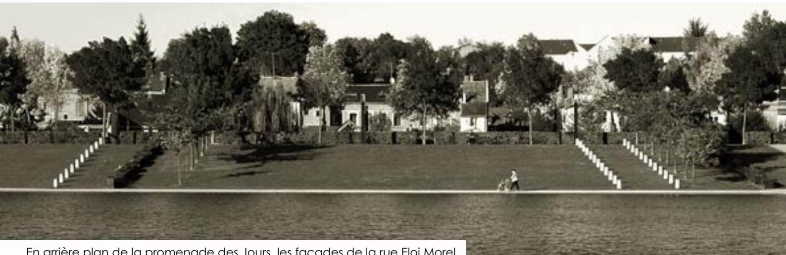
En arrière plan de la promenade des Jours, les façades de la rue Eloi Morel In the background to the Promenade des Jours, the facades of Rue Eloi Morel