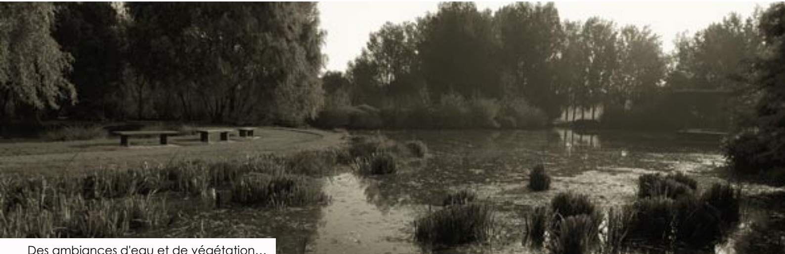
Des ambiances d'eau et de végétation... Water and plant environments ...