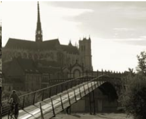
Un principe d'articulation entre les différents espaces de la ville It acts as a hub, connecting the various parts of the town